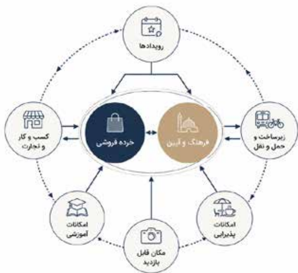
تصویر ۴. مدل مفهومی تعامل شاخص‌های گردشگری شهری مؤثر بر بازآفرینی گذرهای تاریخی از منظر گردشگران.