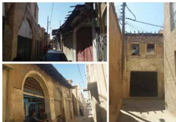
تصویر ۳. فضاهای بازارچه حاج‌زینل و بنای تاریخی تکیه مسجد حاج‌باقر در گذر کوی افشار.

در این پژوهش برای گردآوری داده‌ها از دو شیوه مطالعات کتابخانه‌ای و پیمایش میدانی استفاده شده است؛ از این رو، این پژوهش از نظر نحوه جمع‌آوری اطلاعات در زمره پژوهش‌های اسنادی-میدانی قرار می‌گیرد. به‌منظور تحلیل داده‌ها نیز از ترکیب روش‌های کیفی و کمی بهره گرفته شده است. در بخش کیفی، اطلاعات استخراج‌شده از مبانی نظری با استفاده از تحلیل منطقی و استنتاج استقرایی بررسی شد و در بخش کمی، داده‌های حاصل از پرسش‌نامه‌ها با کمک نرم‌افزار SPSS تحلیل شدند. براساس یافته‌های به‌دست‌آمده از مبانی نظری پژوهش، مجموعه‌ای از شاخص‌های گردشگری مؤثر در بازآفرینی گذرهای تاریخی شناسایی گردید. از آنجاکه شکل‌گیری و توسعه گردشگری در هر فضای جغرافیایی در فرایندی مبتنی بر انطباق میان جاذبه‌ها، سکونت‌گاه‌ها و تسهیلات مورد نیاز زندگی صورت می‌گیرد، نقطه آغاز برنامه‌ریزی گردشگری، شناخت رفتار گردشگران در یک مقصد گردشگری است. این شناخت با ارزیابی وضعیت موجود و بررسی قابلیت‌ها و میزان تطابق آن با نیازها و ترجیحات گردشگران، زمینه‌ای را فراهم می‌کند که فرایند برنامه‌ریزی برای توسعه گردشگری به شکل مؤثرتری انجام شود (Kadivar & Saqae, 2006). همچنین، توسعه گردشگری زمانی موفقیت‌آمیز و پایدار خواهد بود که تمامی گروه‌های اجتماعی، به‌ویژه اقشاری که پیش‌تر نقش و قدرت اثرگذاری کمتری در جامعه داشته‌اند، در فرایندهای تصمیم‌گیری، برنامه‌ریزی گردشگری و بهره‌مندی از منافع آن مشارکت داده شوند. زنان، جوانان،