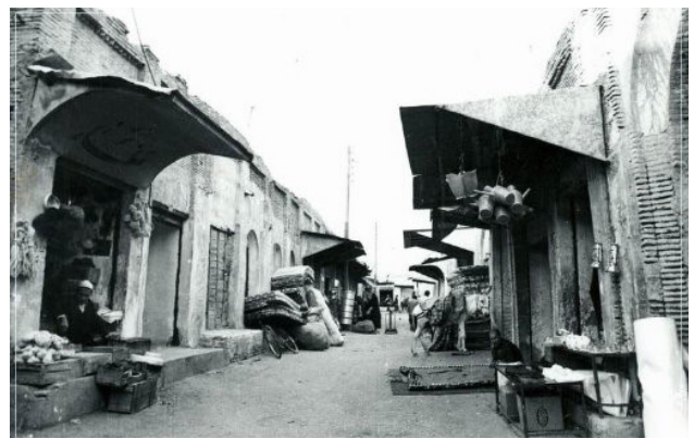
تصویر ۴. معماری بومی بازار دزفول.