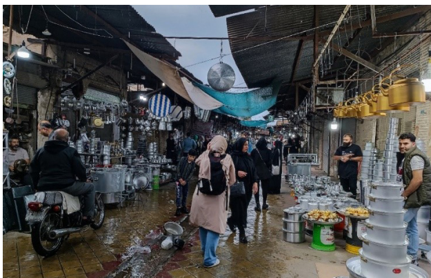
تصویر ۵. پویایی بازار دزفول با وجود کالبد در حال افول. عکس: نگین رجب‌بوجانی، ۱۴۰۳.