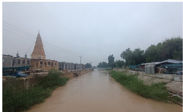
تصویر ۶. بازار در دو لبه رود و در جوار بقعه دانیال نبی (ع). عکس: نگین رجب‌بوجانی، ۱۴۰۳.

بر اساس مشاهدات میدانی، بازار دزفول از منظر کالبدی-معنایی بیشتر به‌عنوان فضایی نیمه‌باز با فضاهای مختلف در کنار هم طراحی شده است که این امر به‌طور مستقیم به تأثیر رود دز بر طراحی آن باز می‌گردد. رودخانه نه‌تنها در شکل‌دهی فضاهای تجاری در کنار خود تأثیرگذار بوده، بلکه به‌دلیل تأمین منابع آبی، باعث رشد کشاورزی و صنایع سنتی شده است که در خود بازار نیز به وضوح مشاهده می‌شود. این ویژگی‌ها باعث شده است که بازار دزفول به‌عنوان مکان‌هایی با اهمیت معنایی ویژه در ارتباط با رودخانه، نه‌تنها فضایی تجاری، بلکه فضایی اجتماعی، فرهنگی و مذهبی نیز محسوب شود. در ابعاد عملکردی-معنایی، بازار دزفول علاوه بر عملکرد تجاری، به‌عنوان مکانی برای تبادل فرهنگی، اجتماعی و حتی مذهبی شناخته می‌شود. در این بازار، کارگاه‌های صنایع دستی در کنار مغازه‌های تجاری وجود دارند که به نظر می‌رسد این ترکیب باعث ایجاد فضایی متنوع و چندمنظوره شده است. این چندمنظوره‌بودن، از تأثیر رود دز به‌عنوان یک عنصر عملکردی در شکوفایی تجاری و اجتماعی بازار نشأت می‌گیرد. در واقع، بازار دزفول با توجه به موقعیت جغرافیایی و تأثیرات رودخانه دز، نقش دوم را در پویایی اجتماعی و فرهنگی شهر