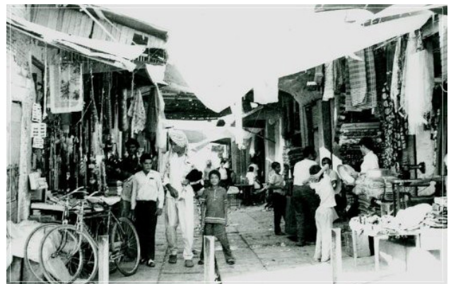
تصویر ۳. عکس‌های قدیمی از بازار دزفول به‌عنوان سند فرهنگی از رویدادپذیری بازار دزفول.

یکی از ویژگی‌های بارز بازار دزفول، هم‌نشینی کارگاه‌های صنایع دستی با فضاهای تجاری است. این ترکیب، که در آن صدای آهنگری، بوی چرم، گردوغبار چوب خراطی و فعالیت‌های روزمره جریان دارد، هویتی خاص به بازار بخشیده و آن را به فضایی زنده و تجربه‌محور تبدیل کرده است. بازار دزفول همچنین در مجاورت عناصر خدماتی و مذهبی مانند کاروانسرا، تیمچه، حمام، قهوه‌خانه و مسجد شکل گرفته است (Darkatanian, 2019) (تصویر ۳)، که