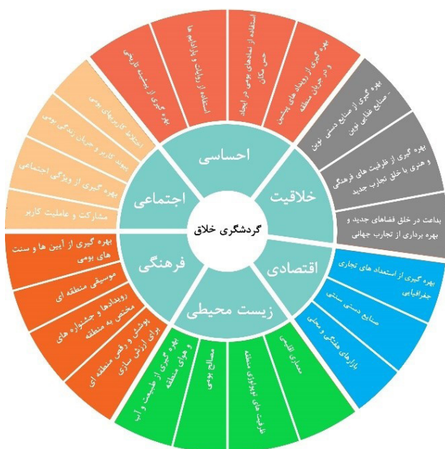
تصویر ۳. الگوی چرخه پویای طراحی فضاهای اقامتی تفریحی در مدل گردشگری خلاق.

هدف اصلی این پژوهش دستیابی به الگوی بهینه طراحی فضاهای اقامتی تفریحی در مدل گردشگری خلاق است. گردشگری خلاق به‌عنوان شیوه‌ای جدید از گردشگری می‌تواند به پیشران مناطق کم‌برخوردار در پیشرفت صنایع گردشگری تبدیل شود. استفاده از الگوی صحیح و مناسب هر منطقه موجب موفقیت و توسعه طرح‌های ذی‌ربط خواهد شد و در مقابل هر گونه فعالیت غیراصولی می‌تواند برعکس، موجب تبعات منفی در ساختار گردشگری و اقتصادی این مناطق شود. در این پژوهش، پژوهشگران به معیارهای طراحی فضاهای اقامتی - تفریحی در مدل گردشگری خلاق در قالب بعدها و شاخص‌های مرتبط پرداختند تا به الگوی مناسب و همه‌شمول از طراحی فضاهای گردشگری دست یابند. برای توسعه و پیشرفت صنعت گردشگری، طراحی فضاهای گردشگری می‌تواند به‌عنوان مولد جدیدی عمل