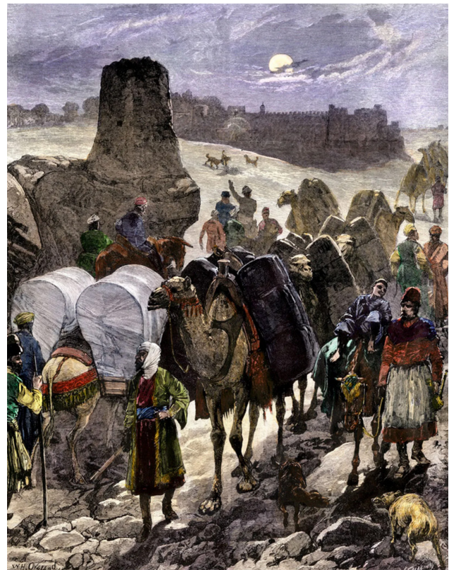
تصویر ۱. نقاشی از کاروان‌های تجاری در جاده ابریشم، آسیای مرکزی.

این پژوهش بر این فرض استوار است که جاده ابریشم به‌طور قابل توجهی مبادلات بین فرهنگی را تسهیل کرد، نه تنها با