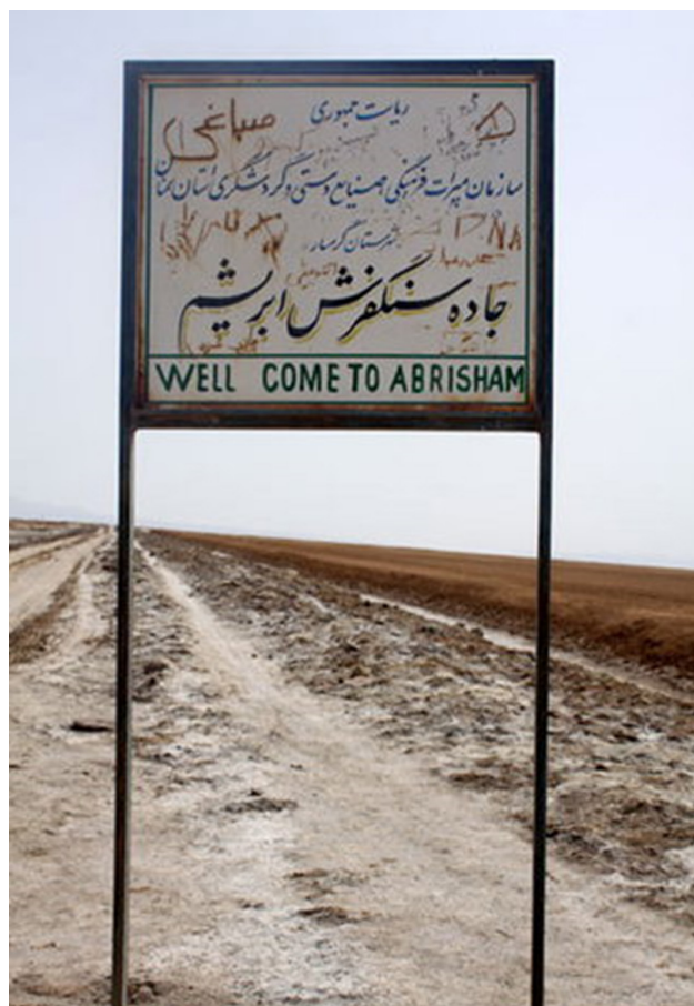
تصویر ۵. بخشی از مسیر جاده ابریشم در کویر گرمسار، سمنان.