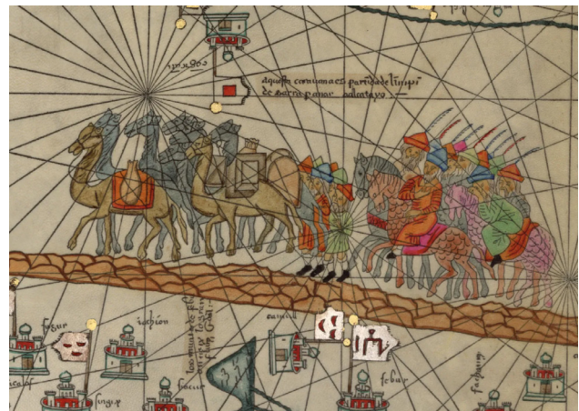
تصویر ۲. کاروان مارکوپولو در مسیر جاده ابریشم.