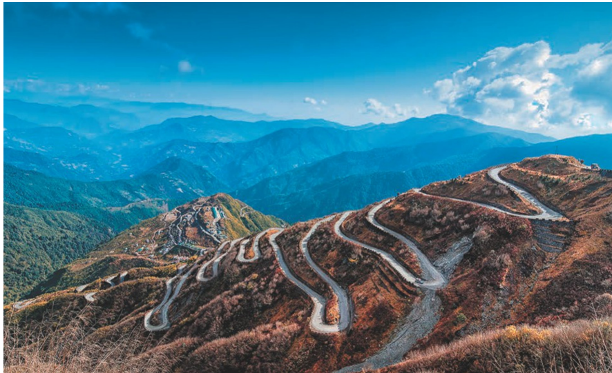
تصویر ۳. جاده‌های کوهستانی در مسیر قدیمی ابریشم بین چین و هند.