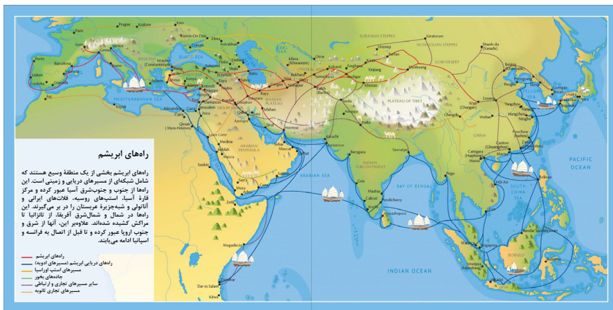
تصویر ۴. شبکه راه‌های ابریشم. نقشه‌ای که مسیرهای مختلف جاده ابریشم را نشان می‌دهد و شهرهای کلیدی و نقاط تجاری را برجسته می‌کند.

مانند ابریشم، ادویه‌جات ترشی جات و فلزات گرانبها مبادله می‌شد. تصویر ۵ نمایانگر بخشی از مسیر جاده ابریشم است که از کویر گرمسار در ایران می‌گذرد. این جاده دست‌ساز در دوره صفوی به منظور گذر راحت‌تر مسافران (در مواجهه با سیلاب‌ها و زمین‌های گل‌آلود) سنگفرش شد (ایسنا، ۱۳۹۲). ایران همچنین به تبادلات فرهنگی، به‌ویژه از طریق دین زرتشتی، که بر تحولات مذهبی در سراسر منطقه تأثیر گذاشت، کمک کرد (Wang, 2016; Chang, 2023).