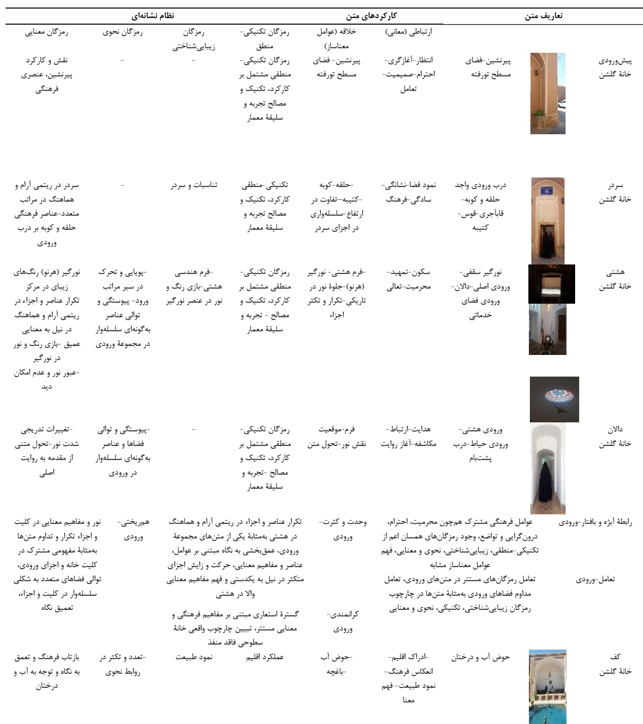
جدول ۴. نشانه‌شناسی فرهنگی خانه‌های سنتی یزد (خانه گلشن).

آن‌ها در قالب متن‌ها براساس عوامل معنا ساز متشکل از عناصر و مفاهیم متعدد بر معانی صریح و ضمنی دلالت می‌کنند. تبیین معانی و مفاهیم ضمنی متن‌های خانه در جداول ۴ و ۵ مبین نقش و کارکرد جملگی شاخصه‌های نشانه‌شناسی فرهنگی اعم از نظام‌های نشانه‌ای مبتنی بر رمزگان تکنیکی-منطقی، زیبایی‌شناسی، معنایی، تعامل،