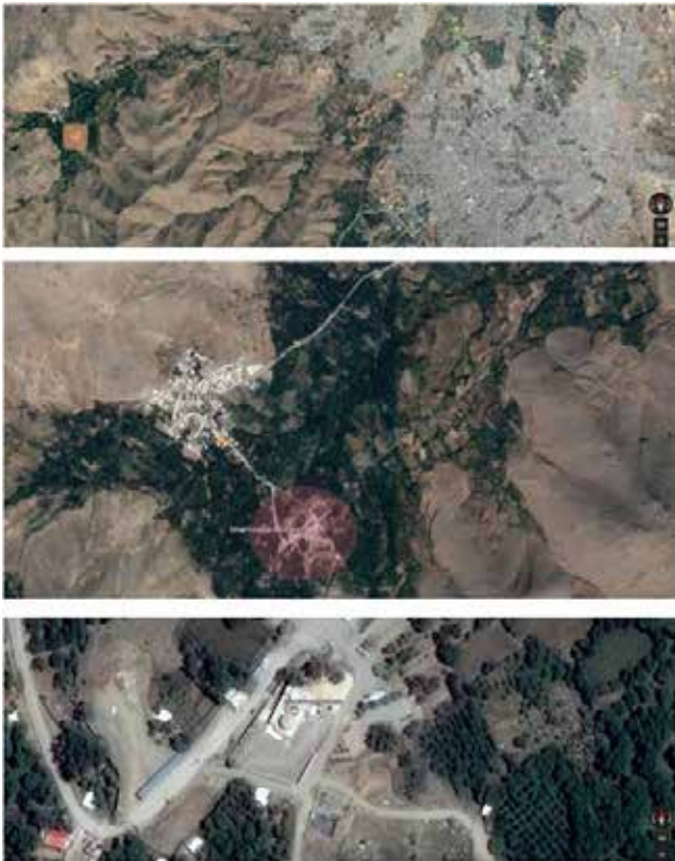
تصویر ۱. محل قرار گیری امامزاده محسن نسبت به شهر.

و حرم است. مقبره شامل دو بنای آجری نسبتاً کوتاه با گنبدی‌های مرتفع شلجی شکل هستند که ظاهراً از آثار دوره ایلخانی محسوب می‌شوند (گروسین، ۱۳۸۳، ۲۳). در جنگ ایرانیان و اعراب از بزرگان عرب نیز - چنانکه گفته‌اند - افرادی نظیر ابودجانہ انصاری (از صحابه رسول اکرم (ص))، ابوصالح تماتی، ابوسمیل و ابوکامل کشته شدند، که مدفن آنان در بقعه امامزاده کوه است (همان، ۲۶). از شواهد برمی آید که دره ماوشان از همان دوران باستان مورد نظر سلاطین و امرا بوده و بقعه بر روی بنای خیلی قدیمی تری، احتمالاً متعلق به دوره ساسانی ساخته شده است، که می‌توانسته آتشکده‌ای باشد، زیرا در جایی ساخته شده است که اشعه آفتاب هنگام طلوع به آنجا می‌تابد و این در ساخت بناهای مذهبی ایران باستان از اهم شرایط بوده است. ثانیاً بافت بنا و دو گنبد که صحن هر کدام بالاتر از دیگری است، دارای سه صفا است که می‌تواند نماد اندیشه نیک، گفتار نیک و کردار نیک باشد. از سوی دیگر وجود نامجای «هشتاد» که به کوه‌های غرب روستای برفین (یا روستای امام زاده کوه) و بقعه امامزاده اطلاق می‌شود، می‌تواند مؤید این نظریه باشد (خرم‌روئی، ۱۳۹۶، ۴۹).