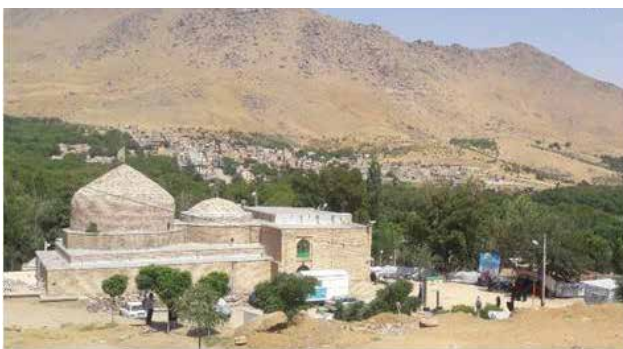
تصویر ۴. منظر آیینی امامزاده محسن و تلفیق آن با طبیعت، مرداد ۱۳۹۵ و در حال مرمت مجدد و بازسازی بنا، عکس: ریحانه خرم‌روی، ۱۳۹۶.

حرم مطهر از جمله سنی است که در این فضای آیینی هر ساله در زمان و مکان مشخص اجرا می‌شود (تصویر ۵). همین اتفاقات و رخداد‌های اجتماعی-آیینی-فرهنگی هستند که منجر به جذب گردشگر داخلی و خارجی به این فضا شده است. همانطور که در ابتدای بحث اشاره شد علاوه بر مکان مقدس امامزاده وجود طبیعت بکر، کوه‌ها و دره‌های پیرامون آن، چشمه‌سارها و رودهای فراوان و همچنین باغاتی که در پیرامون امامزاده وجود دارند، بخش سیاحتی-تفریحی و اقتصادی منطقه را تأمین می‌کنند. معمولاً گردشگرانی که به این منطقه سفر می‌کنند بازه زمانی سفرشان بین یک تا دو روز است. آن‌ها کنار زیارت به تفریح در طبیعت و چادرزنی در