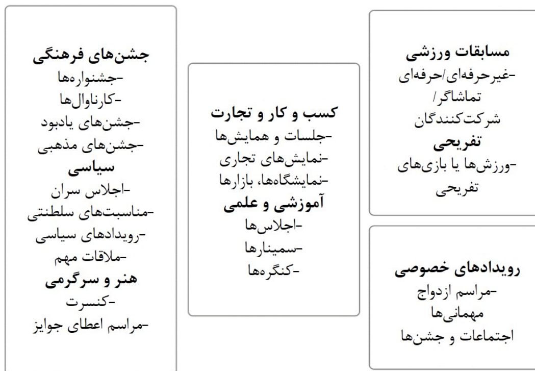
تصویر ۱. گونه‌شناسی رویدادهای برنامه‌ریزی شده بر پایهٔ انواع موضوعی آن‌ها.

ارائهٔ تعریف رویداد به تنهایی کافی نیست و راه‌هایی که می‌توان رویدادها را در دسته‌های مختلف طبقه‌بندی کرد نیز حائز اهمیت هستند. تصویر ۱ زیر طبقه‌بندی رویدادها توسط گتز را نشان می‌دهد که رویدادهای برنامه‌ریزی شده را به هفت دستهٔ مختلف طبقه‌بندی کرده است، این طبقه‌بندی‌ها می‌تواند در هر فرهنگ و جامعه‌ای یافت شود. رویدادها همیشه لازم نیست در یک دسته یا طبقه باشند و می‌توانند بسته به شرایط و اهداف رویداد در دو یا چند طبقه قرار گیرند. تصویر