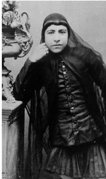
تصویر ۵: کلاغی.