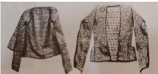
تصویر ۷: ارخالق.

می‌رسید و رفته‌رفته قد دامن آن کوتاه‌تر شد، به طوری که به نیم‌تنه‌ای تبدیل شده بود (تصویر ۸). این بالاپوش فقط به وسیله دکمه بسته می‌شود؛ لباسی که جیب‌های بزرگ دارد کمر را خیلی بیش از واقع بزرگ جلوه می‌دهد (غیبی، ۱۳۹۹، ۵۵۹).