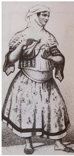
تصویر ۹. خدمتکاری با اراخالق کوتاه.