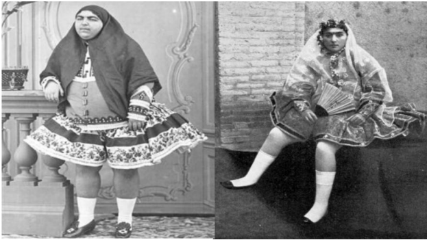
تصویر ۱۱. جوراب.