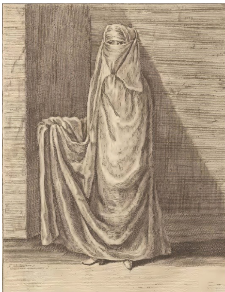
تصویر ۲. پوشش عمومی یک زن ایرانی صفوی در خیابان.