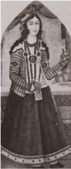
تصویر ۶: زن قاجاری با پیراهن