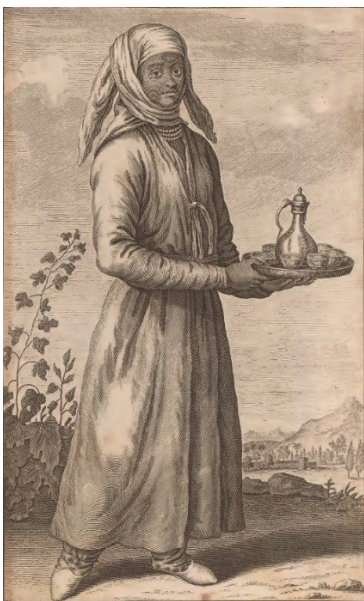
تصویر ۳. نمونه‌ای از پوشاک یک زن خدمتکار دوره صفوی.

چنان‌که ضیاءپور (۱۳۴۹، ۳۵۴) نیز به آن اشاره کرده است. اما میل به حفظ چارچوب سنت‌ها در پوشاک ایرانی به‌طور کلی نفی نمی‌شود. این پیوستگی سلیقه و محصول در تحلیل و نتیجه‌گیری این پژوهش تأثیر مهمی دارد. لباس زنان درباری بسیار متفاوت از لباس زنان عادی بوده و بر اساس مناصب و القاب همسرانشان، متنوع بوده است. چنان‌که در پیشانی‌بند همسران صاحب‌منصبان درباری، استفاده از طلا، سنگ‌های زینتی و پَر حواصیل سیاه، رواج داشته و موهای آنها به‌صورت گیسوان بافته آویزان بوده است (Bruyn, 1737, 214). طبیعتاً به‌صورت سلسله‌مراتبی، براساس موقعیت درباری، نظامی و اقتصادی، کیفیت و ارزش لباس و تزیینات آن تغییر پیدا می‌کرده و لباس همسر یک شاهزاده درباری، دارای تفاوت‌های قابل توجه با یک زن عادی بوده است (تصویر ۱). شاردن (۱۳۳۶، ۲۱۷) در مورد پوشاک عمومی زنان صفوی به این نکات اشاره می‌کند که هرگز جوراب نمی‌پوشند و پاپوش آنها نیم‌چکمه منسوج جوراب‌مانندی بود که تا چهارانگشت بالای قوزک ارتفاع داشت. آنها سر خود را کاملاً می‌پوشاندند و روی آن نیز چارقدی داشتند که تا شانه‌هایشان می‌رسید و گلو و سینه را از روبرو کامل می‌پوشاند. در بیرون از خانه چادر سفید یک‌دستی می‌پوشیدند که از پس آن جز مردمک چشمشان، چیز دیگری قابل مشاهده نبوده است (تصویر ۲). زنان اشراف و سپاهیان بر روی لباس‌های خود توری ابریشمی یا چیزی از این دست می‌پوشیده‌اند که جلوه زیبایی داشته است. زنان متوسط نیز به تناسب موقعیت، شغل و امکاناتشان لباس می‌پوشیدند (تصویر ۳). در ادامه به بررسی پوشاک اساسی روزانه بانوان ایرانی، در دوره صفوی پرداخته می‌شود.