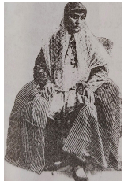
تصویر ۸. زن ایرانی با کلیجه بلند و چارقد.