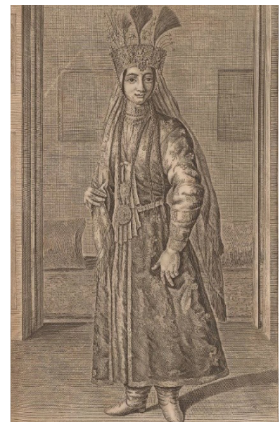
تصویر ۱. نمونه‌ای از پوشاک همسر یک صاحب‌منصب صفوی.