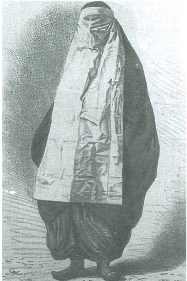
تصویر ۱۵. زن قاجاری با چادر سیاه و روبنده مخصوص. مأخذ: یآوری و حکاک‌باشی، ۱۳۹۸، ۹۰.

اما نکته مهم دیگری نیز درباره تحولات پوشاک زنان در دوره قاجار وجود دارد که قابل توجه است. بررسی تطبیقی پوشاک زن ایرانی و اروپایی نشان می‌دهد آن دسته از البسه که در آنها تظاهر یا تبرج بر دو مقوله «راحتی» و «زیبایی» تسلط داشته، مورد استقبال زن قاجار قرار نگرفته‌اند. برخلاف اروپا که سلیقه زیبایی‌شناسی واحدی همچون قد بلند، کمر باریک و سینه درشت برای زنان در پوشاک درباریان و خدمتکاران مطلوب و تأثیرگذار بود و به‌واسطه آن لباس‌های شکل‌دهنده‌ای همچون گُرس ۷