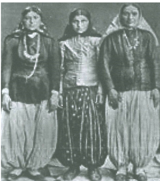
تصویر ۱۰. شلوار.

ط) کفش: زنان متمول در اندرون کفش‌های کوچکی