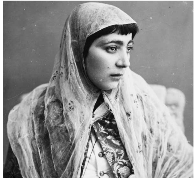
تصویر ۴: چارقد.