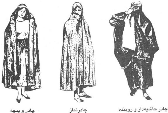
چادر و پیچه