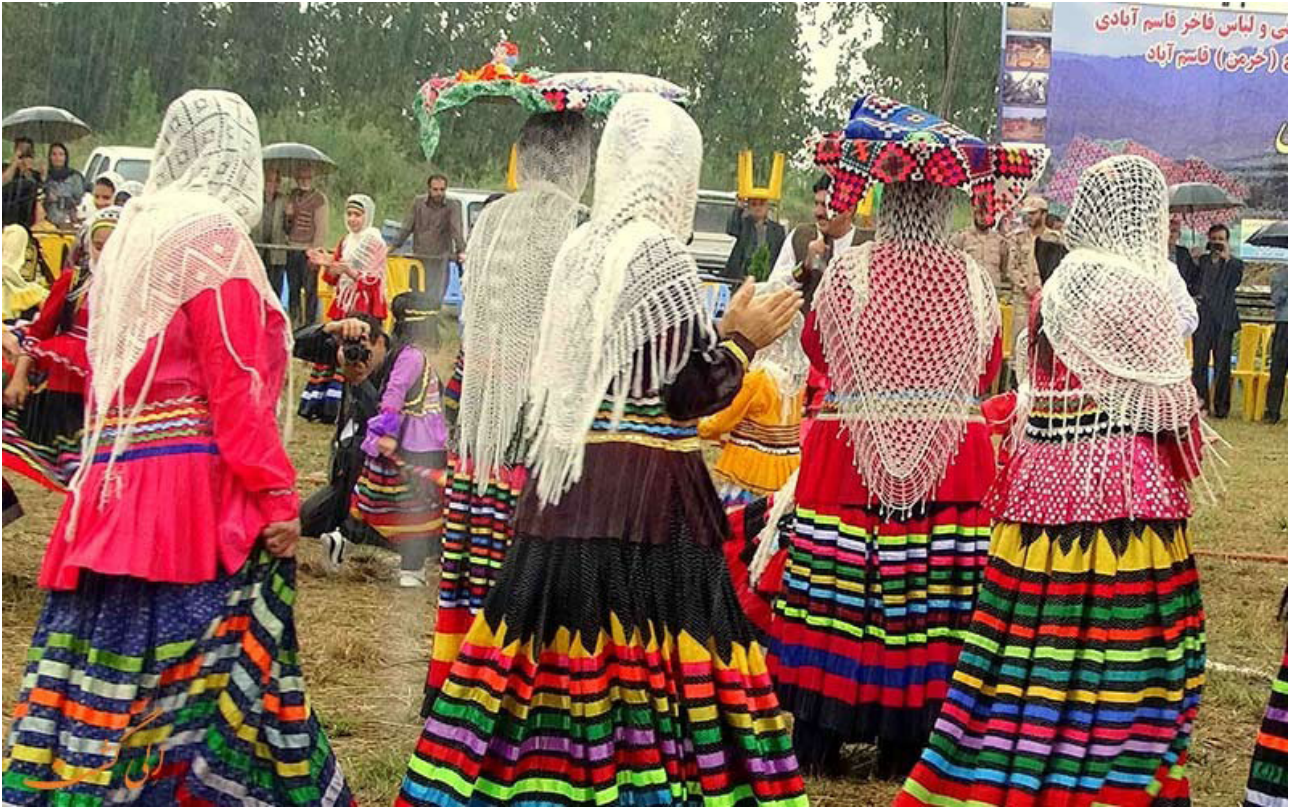
تصویر ۲. پوشاک زنان شمال ایران.