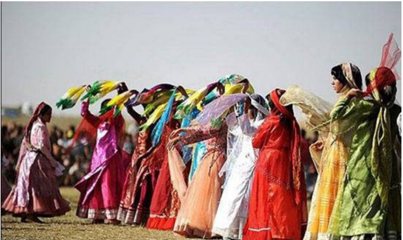
تصویر ۳. پوشاک زنان قشقایی.