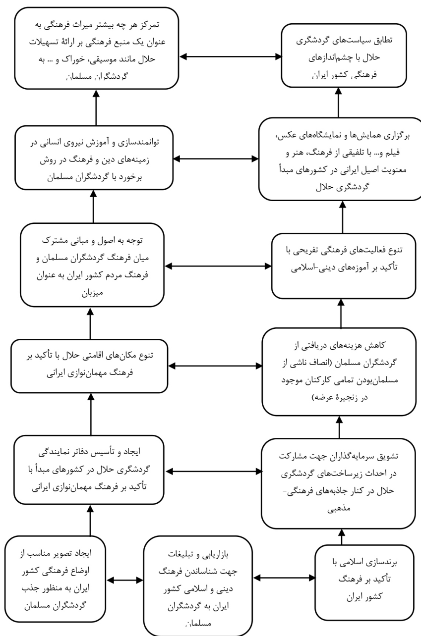
تصویر ۲. مدل شاخص‌های دینی و فرهنگی مؤثر بر توسعه گردشگری حلال در سیاست‌های اجرایی کشور ایران. مأخذ: نگارندگان.

دیگر، در کنار وابستگی بسیار پایینی که به دیگر شاخص‌ها دارد، خود بیشترین تأثیر و قدرت نفوذ را بر سایر شاخص‌ها داراست و تمرکز بر آن، خود بهبود شاخص‌های دیگر را به دنبال خواهد داشت که در نهایت، بهبود تمامی شاخص‌ها، باعث رشد و توسعه گردشگری حلال را در کشورمان می‌شود. موضوع قابل توجه دیگر این است که علی‌رغم همگامی و هم‌زمان بودن شروع برنامه توسعه ایران با کشورهای توسعه‌یافته جهان، با گذشت حدود هفتاد سال در تدوین ساختارمند و هدفمند اسناد برنامه‌های توسعه و راهکارها و سیاست‌های اجرایی جهت رشد صنعت گردشگری کشورمان،