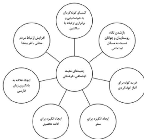
تصویر ۲. نمونه‌ای از ترکیب کدها برای جنبه‌های مثبت اجتماعی-فرهنگی کوله‌گردی.