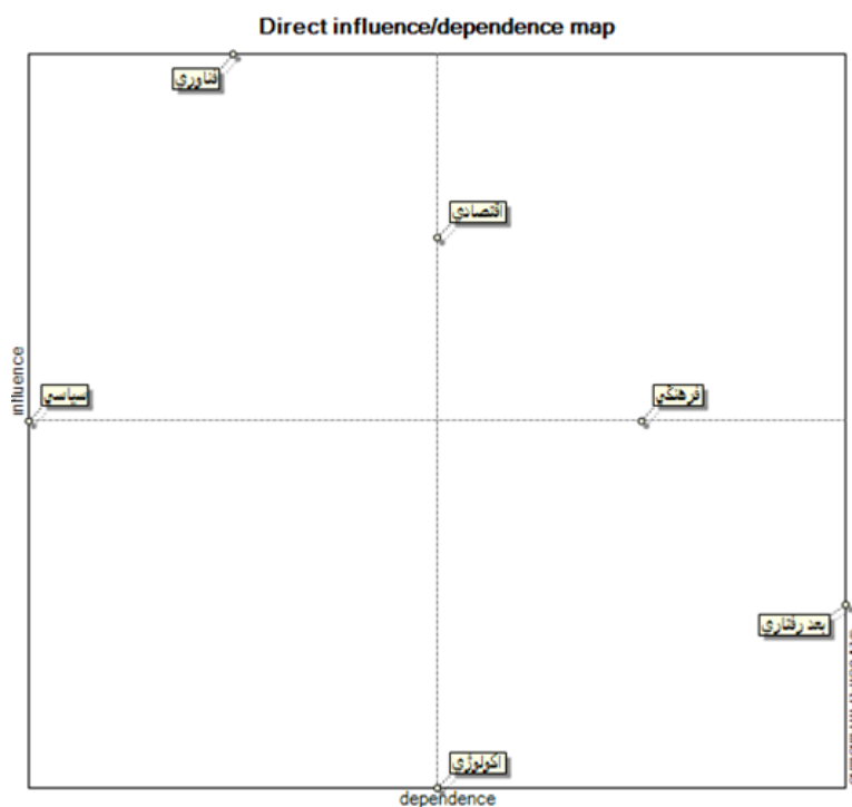
تصویر ۲. نقشه و پراکنش اثرگذاری مستقیم پیشران‌ها در نواحی چهارگانه در تحلیل پیشران‌های کلیدی شکل‌گیری رفتار گردشگر در ایران در پارادایم جهانی‌شدن و توسعه پایدار.