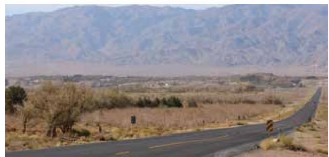
تصویر ۲. ارتباط بلافاصله زیرساخت‌های معیشتی و راه به عنوان عنصر ارتباط‌دهنده معیشت و زندگی در منظر روستایی، روستای رابن، کرمان. عکس: میثم خلیل‌پور، ۱۳۹۶.

• زلزله: بازخوانی و بازشناسی تغییر منظر روستایی کرمان تاریخچه رخداد زلزله‌های تاریخی در استان کرمان و همچنین اهمیت زلزله‌های اخیر رخ داده در پیرامون کرمان همگی نمایانگر ویژگی این ناحیه از نظر لرزه‌خیزی است. در سده اخیر کرمان به عنوان مرکز زلزله‌های ایران، شاهد شدیدترین زمین‌لرزه‌های کشور بوده است. در سال ۱۳۶۰ به فاصله کمتر از دو ماه بخش وسیعی از استان کرمان به لرزه درآمده؛ زلزله اول به بزرگی ۶/۸ در مقیاس ریشتر به مرکزیت شهر «گلباف» رخ داد که موجب شد این شهر به کلی ویران شود. اما دومین زلزله که در ششم مرداد ماه ۱۳۶۰ به وقوع پیوست، با بزرگی ۷/۱ در مقیاس ریشتر شدیدترین زلزله استان کرمان و یکی از شدیدترین زمین‌لرزه‌های ایران محسوب می‌شود. این زلزله که در نزدیکی روستای «سیرچ» رخ داد به‌حدی شدید بود که در جریان آن حدود ۸۵ درصد بافت