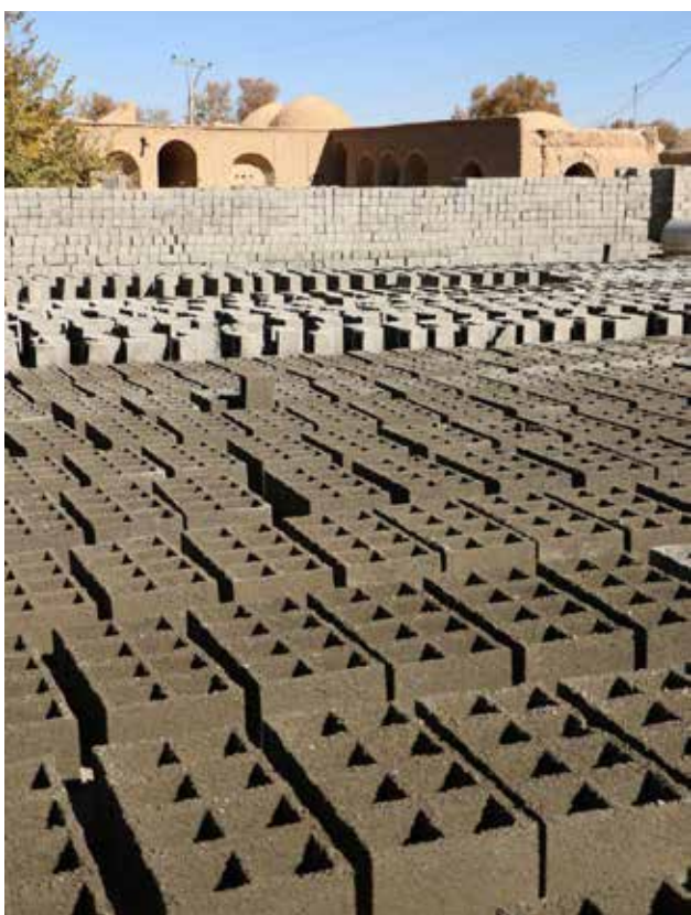
تصویر ۴. تحول منظر بومی روستا به دلیل تفاوت مصالح بومی و مصالح جدید، روستای اسماعیل‌آباد، کرمان.

زلزله‌های رخ داده در سال ۱۳۶۰ -مانند سیرچ و گلباف- نیاز به بازسازی مجدد از یک‌سو و دستورالعمل طرح هادی روستایی از سوی دیگر، توسعه روستاهای کرمان را به سمت سیاست‌های شهری و نه برنامه‌ریزی در مقیاس روستا سوق داد. ویرانی‌های ناشی از زلزله‌ها در سکونتگاه‌های روستایی این شائبه را ایجاد کرد که مصالح سنتی از دوام کمتری نسبت به مصالح جدید برخوردار هستند. بر این اساس شکل و صورت روستاها پس از عملیات نوسازی و بهسازی دستخوش تغییر شد، اما آنچه به عنوان نتیجه طرح‌های هادی در روستاهای زلزله‌زده استان کرمان باقی مانده