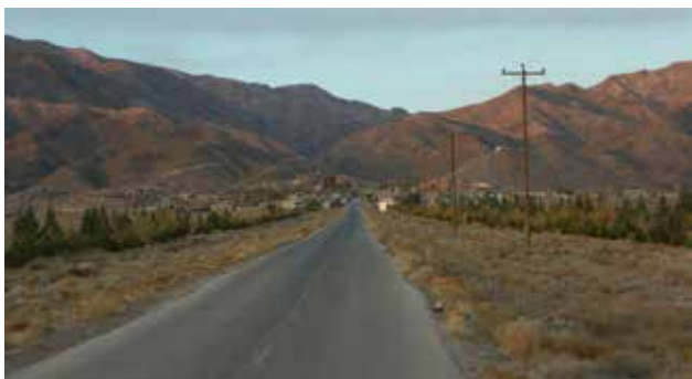
تصویر ۳. طرح کاشت جدید در جداره راه و مسیرهای دسترسی روستایی بدون پیوند با مؤلفه‌های هویتی روستا، روستای تیکدر، کرمان. عکس: میثم خلیل‌پور، ۱۳۹۶.