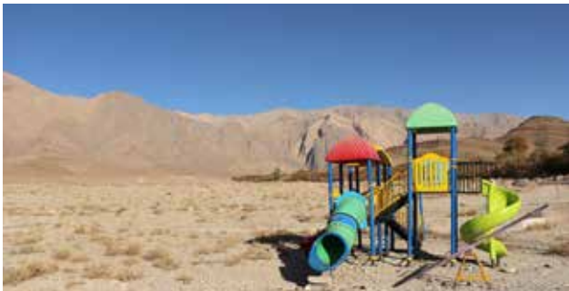
تصویر ۵. حضور مصادیق زندگی شهری در روستا به عنوان نمادهای جدید منظر روستایی، روستای سه کنج، کرمان. عکس: میثم خلیل پور، ۱۳۹۶.