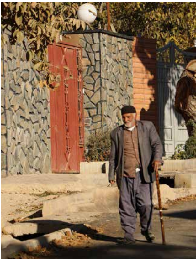
تصویر ۶. به کارگیری مصالح نوین و شیوه‌های ساخت شهری به گونه‌ای نامرتب با میراث منظر روستایی، استان کرمان. عکس: میثم خلیل پور، ۱۳۹۶.

نتیجه عوامل ذکر شده از جمله بلایای طبیعی، دستورالعمل‌های مدیریتی و تغییر نگرش ساکنان روستا، پدید آمدن منظر از روستاست که در هیچ‌یک از ابعاد، پیوندی با ساختارهای قدیمی روستا و منظر آن برقرار نساخته و بر این اساس خوانشی به نام روستا و منظر روستایی در مخاطب شکل نخواهد داد. در صورت عدم تغییر نگرش به روستا به مثابه میراثی غنی و فرهنگی و ادامه روند حاکم بر سیاست‌های نوسازی و بهسازی در زلزله‌خیزترین پهنة کشور، دیری نخواهد پایید که از هویت منظر روستایی استان کرمان چیزی برجای نخواهد ماند.