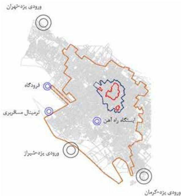
تصویر ۲. موقعیت ورودی اصلی شهر یزد و عرصه و حریم میراث جهانی یزد.

شهر یزد دارای یک فرودگاه بین‌المللی، یک ایستگاه قطار و دو ترمینال اتوبوس (درون‌استانی و بیرون‌استانی) و سه ورودی اصلی خودرواز سمت تهران، کرمان و شیراز است (عالم‌زاده، کریمی، قاندي و غالبی، ۱۳۸۶). تصویر ۲ موقعیت این ورودی‌ها را نشان می‌دهد.