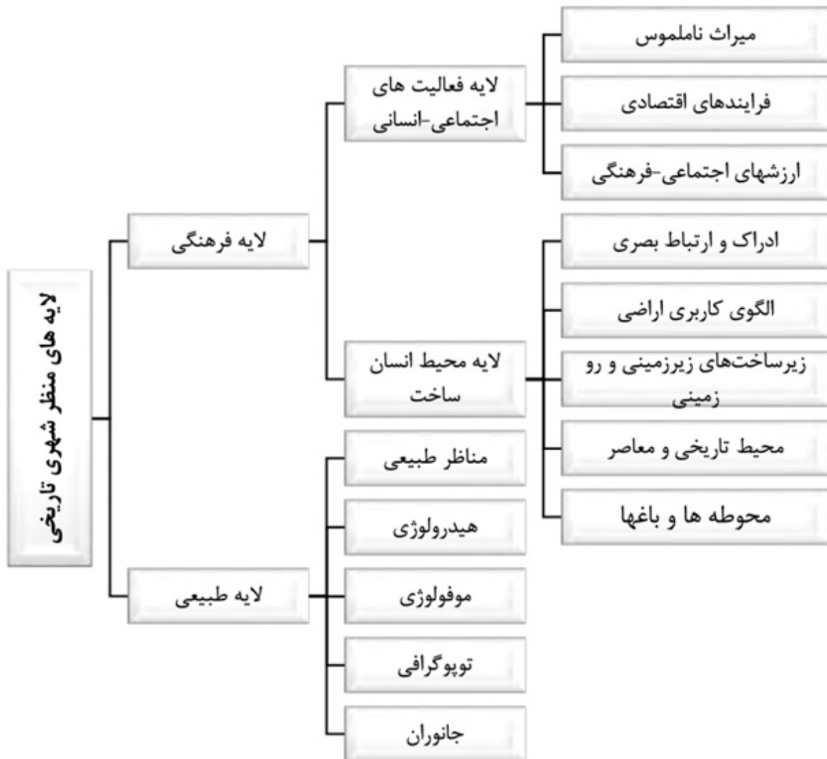
تصویر ۱. لایه‌بندی منظر براساس رویکرد منظر تاریخی شهری.

پایدار در جهت ارتقای شهر نباید این اصل نادیده گرفته شود. تاریخ خمیر به قبل از دولت صفوی و حمله پرتغالی‌ها به هرمز برمی‌گردد. تنها سند موجود در ارتباط با تاریخچه بندر خمیر مکتوبات سدیدالسلطنه کبابی در کتاب بندرعباس، خلیج فارس و سفرنامه ابراهیم بیگ است و این نشان از اهمیت تاریخی شهر بندری خمیر می‌دهد (دژگانی، ۱۳۸۷). اقدامات انجام‌شده مدیریت شهری در راستای توسعه شهر خمیر از جمله خیابان‌کشی‌ها و ایجاد ساختارهای جدید و همچنین زیرساخت‌های زیرزمینی و روزمینی در جهت تداوم تاریخی پیش‌رفته و تماماً براساس یک سیاست مدیریتی شهر نوین صورت گرفته است. به طوری که عدم توجه صحیح به مدیریت آب‌ها باعث آب‌گرفتگی در معابر و ایجاد اختلال در مسیر پیاده شهری شده است که تماماً باعث آسیب به بافت تاریخی می‌شوند. این امر با رویکرد منظر شهری تاریخی