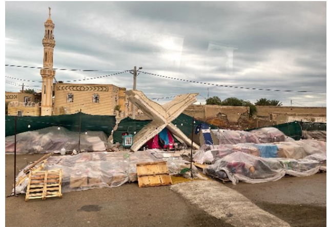
تصویر ۹. عدم سازماندهی اقتصادی و ایجاد سیمای شهری نامناسب.