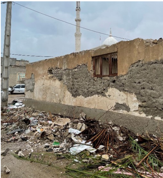
تصویر ۶. مدیریت نابسامان شهری و ایجاد سیمای شهری نامناسب.