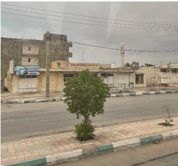
تصویر ۴. عدم وجود پوشش گیاهی تعریف‌شده و مشخص در بلوارها، عدم یکپارچگی در سیما.