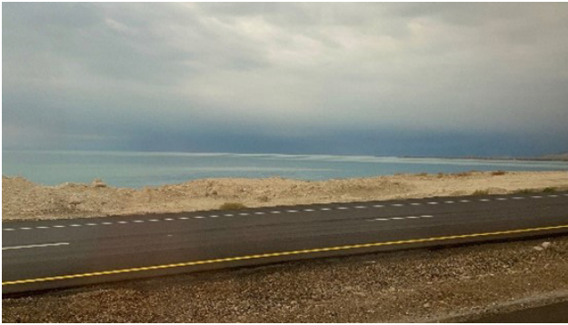
تصویر ۳. خیابان کشی و تجاوز به حریم دریا.