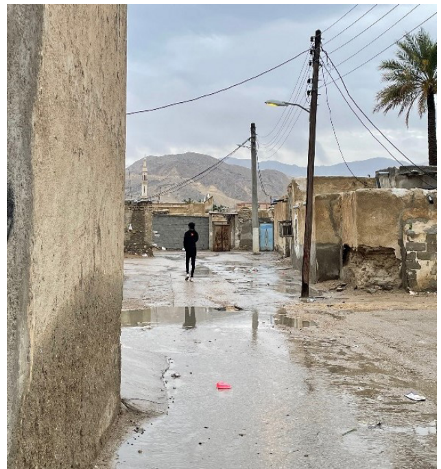
تصویر ۲. عدم توجه به مدیریت آب‌ها و در نتیجه جمع‌شدن آب باران در معابر.

عرصه شهری واجد ارزش‌هایی هم‌عرض است که یکی از پایه‌ای‌ترین این ارزش‌ها، بستر طبیعی هر مکان است. بستری که با تلاش آدمی به مکانی مصنوع و مطبوع بدل می‌شود. تعامل میان انسان و طبیعت است که نیروهای بالقوه بستر طبیعی را به‌روز و به فعلیت می‌رساند. ویژگی‌های بستر طبیعی و نحوه ساماندهی محیط مصنوع از جمله ارزش‌های ملموسی هستند که در شکل‌دادن به منظر شهری تاریخی نقشی پایه‌ای و اساسی را ایفا می‌کند و می‌تواند از مؤلفه‌های اصلی رویکرد مذکور باشد. عناصر اصلی طبیعت و منظرین شهر بندری خمیر به ترتیب اهمیت شامل دریا، جنگل‌های حرا و کوه هستند. از این‌رو مؤلفه طبیعی از جمله مؤلفه‌های اصلی و بنیادین در رویکرد منظر شهری تاریخی در شهر بندری خمیر است که نمی‌توان از آن چشم‌پوشی کرد. خیابان کشی در عرصه عمومی، دریدن حصار، تجاوز به حریم دریا و عدم وجود پوشش گیاهی تعریف‌شده و مشخص در خیابان‌ها، با رویکرد منظر شهری تاریخی در تناقض است. از طرفی حفظ دید به کوه به‌عنوان عنصری منظرین در کریدورهای شهری نشان از هم‌راستابودن مدیریت شهری در این بخش با رویکرد منظر شهری تاریخی دارد (تصاویر ۳، ۴ و ۵).