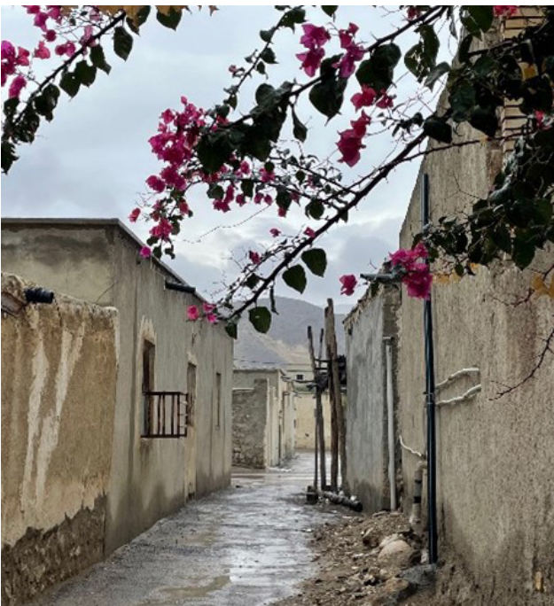
تصویر ۵. کریدور بصری در شریان‌های شهری و دید و منظر کوه، به‌عنوان عنصر طبیعی. مأخذ: آرشیو نگارنده، ۱۴۰۱.

و حفظ ارزش‌های تاریخی در تناقض است و دچار انقطاع مفهومی شده است. این انقطاع باعث می‌شود که ارتباط توسعه‌آمروزی خمیر با مفاهیم منظر شهری تاریخی برقرار نشود (تصویر ۲).