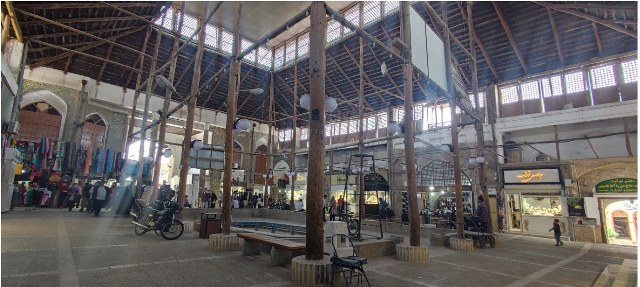
تصویر ۳. تکیه ناسار شهر سمنان و حوض ساخته‌شده در آن.