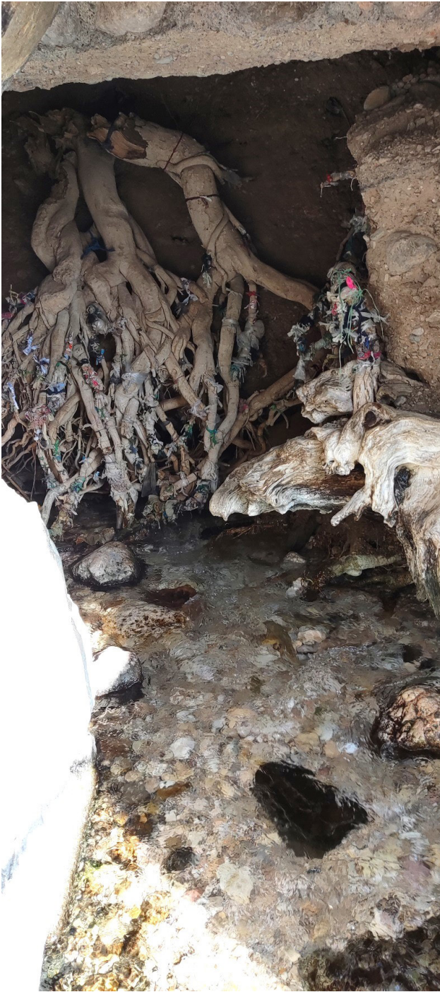
تصویر ۵. دخیل بستن به ریشه درختان چنار پیرامون چشمه‌علی دامغان. عکس: ریحانه خرم‌روئی، ۱۴۰۱.

و برتری‌دادن ندارد و همواره درهم‌تنیده شده است، منجر به تولید فضای شهری با کیفیتی شده که در سایه آن بسیاری از آداب و رسوم و نحوه برخورد درست با طبیعت شکل گرفته است. از این رو آب به‌عنوان عنصری طبیعی، وجهی نمادین و عملکردی مهم در دو شهر سمنان و دامغان ایفا می‌کند. عنصری که در دو نقش اثرگذار و اثرپذیر در شهر به تعریف و سازماندهی اندام‌های مختلف شهر در وجه کالبدی و باورهای