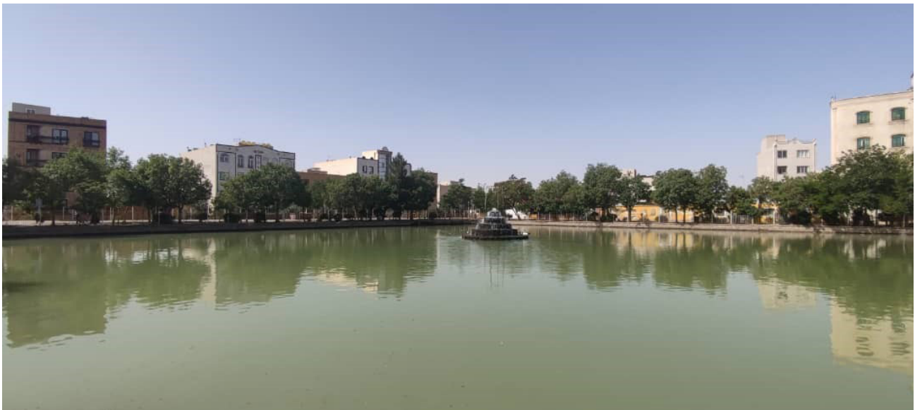
تصویر ۴. استخر باغ فیض سمنان، یکی از استخرهای شش‌گانه سمنان که آب آن وارد محلات ناسار و اسفنجان می‌شود.

رسم‌های آیینی نظیر عاشورا را با شکوه هرچه تمام‌تر برگزار می‌نمایند. لذا بر اساس ماهیت کالبدی آب در فضای شهری سمنان و دامغان و اثربخشی‌ای که در زنده‌کردن اقلیم گرم و خشک منطقه دارد، ذهنیتی خوش از آب برای مردم ایجاد شده که در کنار کارکرد آب، همواره این عنصر حیات‌بخش به عنصری قابل احترام و تکریم تبدیل شده است.