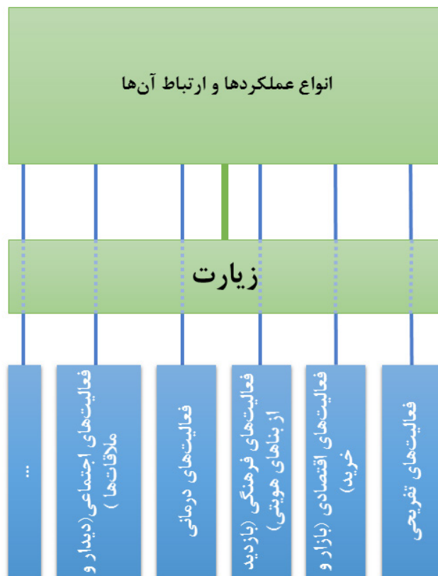
تصویر ۳. نسبت امر زیارت با گردشگری.

در همه سفرنامه‌های بررسی‌شده در این پژوهش پیرامون شهر مشهد معمولاً بخش عمده نگارش به توصیف نقش و جایگاه حرم در شهر و فعالیت‌های مرتبط با آن پرداخته شده است و این‌گونه