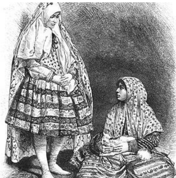
تصویر ۳. نمونه ای پوشاک دوره قاجار.

سرزمین ایران با توجه به تنوع جغرافیایی و نیز فرهنگی منحصر به فرد خود، پوشاک و لباس های سنتی متنوعی دارد که از ذخایر فرهنگی و هویتی ایرانیان است. ایرانیان در هزاره های باستانی تاریخ به جامه ها و آرایش خود ارج فراوان می نهادند و همه ذوق هنری و کوشش خویش را برای خلق جامه های هنری