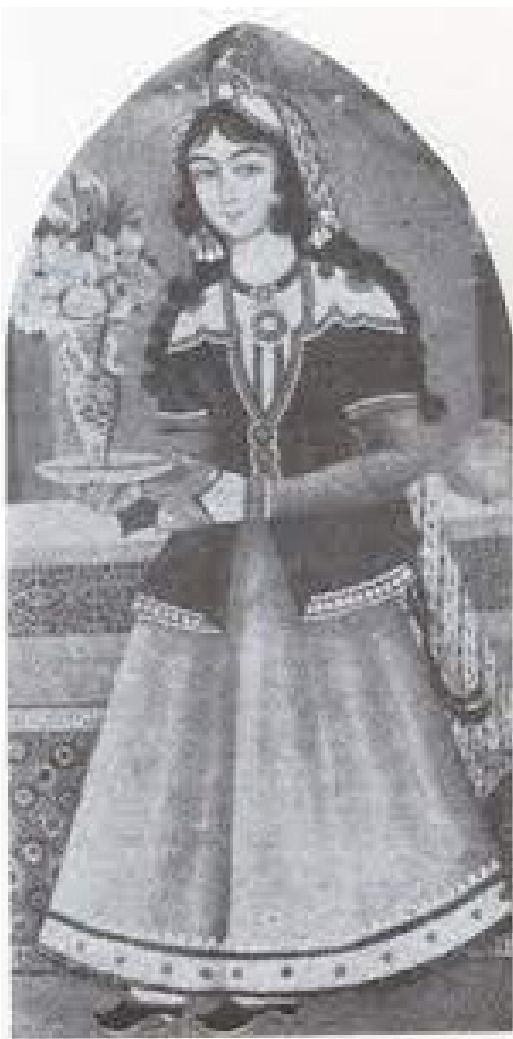
تصویر ۲. پوشاک دوره ساسانی.

یکی دیگر از مؤلفه‌های مرسوم پوشش در میان ایرانیان کراوات‌های آریایی‌تبار است (تصویر ۲). درباره ریشه ایرانی کراوات و چگونگی صدور آن به امپراطوری روم در دوران ساسانی، استفاده از کراوات توسط قوم ایرانی‌تبار اهل کرواسی و بعدها رفتن این نشانه به انگلیس و فرانسه و سایر نقاط اروپا مطالب بسیاری گفته شده است؛ در پژوهشی پیرامون تاریخچه کراوات آن را یک نماد اسلامی معرفی کرده‌اند که در جنگ‌های صلیبی مسلمانان قوم کراوات برای اولین بار از آن استفاده کرده‌اند. واژه کراوات یا هرروات (hravat) در زبان صربی ریشه ندارد بلکه این نام بر لوح سنگی در ناحیه یونانی‌نشین جنوب روسیه پیدا شده است. در زبان اوستایی خراوات (khoravat) به معنی دوستانه است. این نشانه همان دیهیم و نماد مقدس ساسانی است که به معنای پیوند و دوستی با اهورامزدا و ایزدان مهر و آناهیتا تعبیر می‌شود (آورزمانی، ۱۳۹۲). سرپوش در روزگار گذشته در میان پوشاک و لباس انسان‌ها چه زن و چه مرد، از مهم‌ترین بخش‌ها به شمار می‌آمده است. تاج شاهان یکی از سرپوش‌ها بوده است. این سرپوش در نقش‌های باستانی بسیار به چشم می‌آید. پاره‌ای شواهد نشان می‌دهد در دوره اسلامی هنگام محاکمه یک شاه یا شاهزاده، نخست سرپوش او را برمی‌داشتند که رفتاری توهین‌آمیز به شمار می‌آمد. گونه‌هایی فراوان از کلاه‌ها در ایران باستان حتی پیش از ورود آریایی‌ها رواج داشته است که تصویر آن‌ها بر نقش‌های گلی که به شکل مهر هستند دیده می‌شود. کلاه‌های شاخ‌دار از معروف‌ترین و مهم‌ترین نمونه‌های کلاه‌هایی به شمار می‌آمده که در ایران برای طبقه‌های بالای اجتماعی به‌ویژه شاهان و شاهزادگان به‌کار