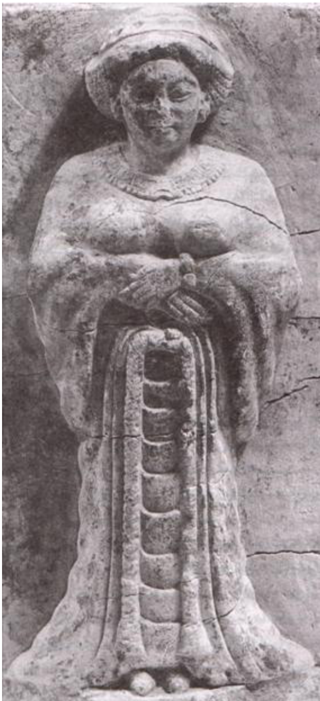
تصویر ۱. پوشاک دوره هخامنشیان.

هخامنشیان، مردمان گستره سرزمین ایران جامه‌های قومی خود را می‌پوشیدند. در نمونه‌هایی از بازنمایی‌های زنان هخامنشی، پارچه نازک و بلندی همانند چادر دیده می‌شود که زن آن را روی سر و جامه بلند و چین‌دار خود افکنده است (تصویر ۱). شل یکی دیگر از پوشش‌های ایرانیان باستان بوده است. به طوری که از شل کوتاه بهره می‌گرفتند که پوشیده نمی‌شد، آن را بر شانه‌ها و گرده‌ها از پشت می‌آویختند و البته گاه تا زانوان و حتی پایین پا می‌رسید. کاربرد این گونه شل‌ها البته رفته‌رفته به‌ویژه در دوره‌های پس از یورش مغولان کاهش یافت. قبا، پوششی