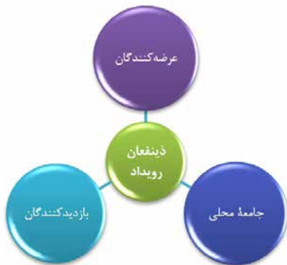
تصویر ۱. مدل دینفعان رویداد.

تحقیق حاضر از نوع بنیادی و به روش تحلیلی-نظری با استفاده از تحلیل مطالعات اسنادی است. بر این اساس محقق مبتنی بر نظر حافظنیا (۱۳۸۵، ۲۳۲) با استفاده از عقل و منطق و اندیشه اسناد، مدارک و اطلاعات را مورد بررسی و تجزیه و تحلیل قرار داده و حقیقت و واقعیت را کشف نموده است و در گام دوم برای تأیید تحلیل صورت‌گرفته از تکنیک دلفی بهره گرفته شده است. تحلیل ابعاد و شاخص‌های مربوط به ادراک و تجربه دینفعان از رویداد بدین صورت انجام گرفت که ابتدا با استفاده از روش تحلیل محتوا شاخص‌ها و استانداردهای اولیه جمع‌آوری و هم‌مفهوم‌سازی شد. پس از ارائه شاخص‌های منتخب خروجی کدگذاری و هم‌مفهوم‌سازی محقق، در گام دوم به روش دلفی و از دیدگاه کارشناسان مدیریت رویداد که به تعداد ۲۵ نفر با روش گلوله‌برفی انتخاب شده بودند به صورت اجماع و تکرار، اقدام به تدوین ابعاد و شاخص‌های تحلیلی نهایی شد. این فرایند با توجه به اشباع نظرات در دو مرحله (اجماع اولیه و نهایی) اقدام و بدین منظور از ضریب کندال ۳ در قالب نرم‌افزار SPSS ۲۲ که برای تعیین میزان هماهنگی در نظرات کارشناسی در شیوه دلفی به کار می‌رود، استفاده شد.