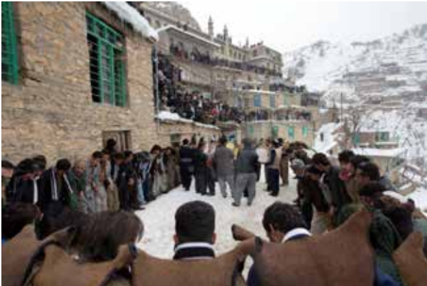
تصویر ۴. مراسم آیینی پیر شالیار در روستای اورامانات از جمله آیین‌های طبیعت‌گرا در فرهنگ ایرانی و یک جاذبه گردشگری در استان کردستان، عکس: محمد بارکار، ۱۳۹۵.