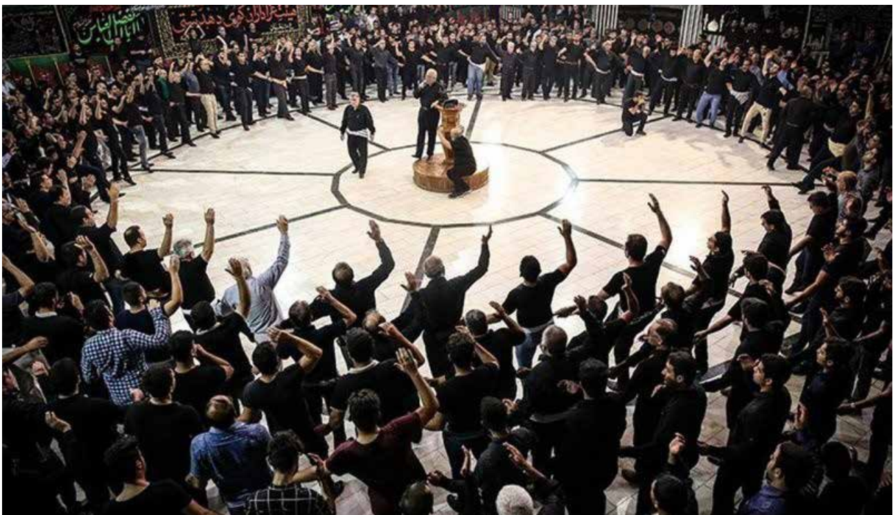
تصویر ۵. مراسم عزاداری سیدالشهدا در بوشهر یکی از رویدادهای آیینی سالانه در ایران.

سه عامل طبیعت، انسان و محیط انسان‌ساخت سه وجه اصلی سازنده مناظر آیینی هستند که هر یک شاخصه‌های منحصر به فردی را برای این مناظر رقم زده‌اند. شناخت مؤلفه‌های هویتی و فرهنگی، استمرار باورها و معانی، بهبود ماهیت مشارکتی تجربیات گردشگری از جمله نتایج نگاه گردشگری منظر به مقوله آیین‌هاست. بازخوانی محتوای اجتماعی، معنایی و کالبدی مناظر آیینی در قالب اماکن و رویدادهای آیینی، زمینه را برای شناخت فرهنگ جوامع و مقاصد گردشگری فراهم آورده و کیفیت سفر را از کسب داده‌ها و اطلاعات به درک زمینه‌های فکری و معنایی نهفته در آیین‌ها به‌عنوان پدیده‌هایی فرهنگی افزایش می‌دهد (تصویر ۶).