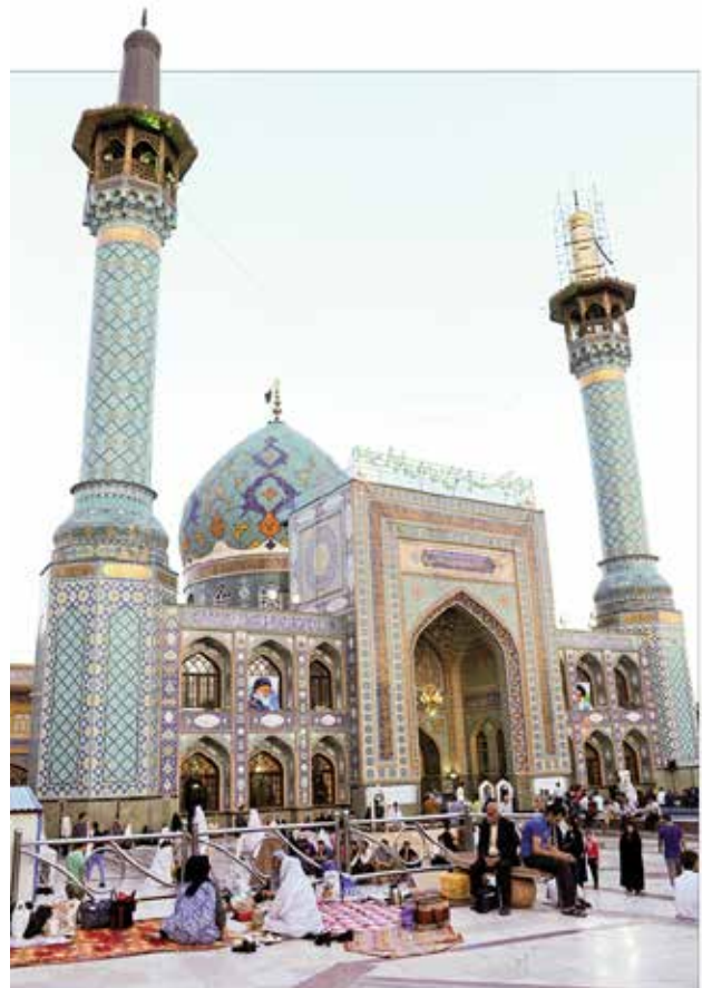
تصویر ۲. زیارت و تفریح توأمان به عنوان یک محرک گردشگری و پدیده‌ای فرهنگی در منظر آیینی زیارتگاه امامزاده صالح در تهران.

قوی‌تر از فضاهایی است که از فردیت بیشتری برخوردارند. ویژگی اجتماعی آیین‌ها منجر به بهبود ماهیت مشارکتی و اجتماعی تجربیات گردشگری شده و امکان تجربه اثرگذار اصالت و تفاوت فرهنگی را برای شرکت‌کنندگان و گردشگران فراهم می‌آورد. در نتیجه ویژگی‌های اجتماعی، در بسیاری از جوامع از جمله ایران، اماکن آیینی با برخورداری از ویژگی‌های اجتماعی پیوند نزدیکی با تفریح و گردش داشته‌اند. در هم آمیختگی مفهوم زیارت به‌عنوان عملی آیینی با مفهوم تفریح از نمودهای بارز وجه جمعی آیین‌ها نزد ایرانیان است. این مسئله سبب شکل‌گیری سنت زیارت-تفریح و سفرهای زیارتی در میان ایرانیان شده که در آن تفریح و زیارت به‌شکلی همسو صورت می‌پذیرد تا به‌حدی که ردپای آن در نوشته‌های سفرنامه‌نویسان و حتی اشعار فولکلور و مردمی نیز مستند شده است (تصویر ۲). چنین سفرهایی گردش و استراحت را با حال و هوای روحانی و معنوی در هم می‌آمیزد. به‌گونه‌ای که زائرین در گذشته در سفرهای زیارتی تا یک ماه در مشهد مقدس و گاه شش ماه در کربلا و در جوار حرم امام حسین (ع) و حضرت علی (ع) به‌سر می‌بردند (جوادی، ۱۳۹۷).