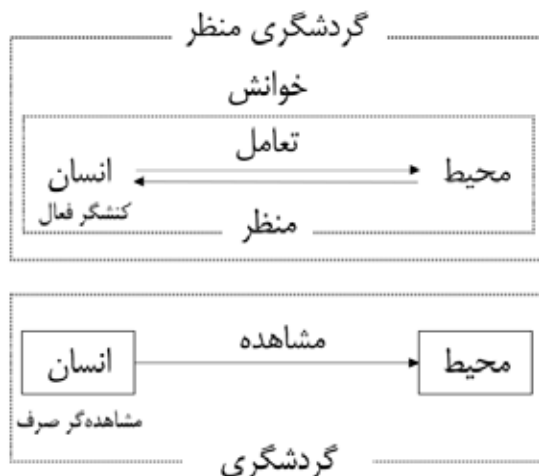
تصویر ۱. مدل مفهومی گردشگری منظر، مأخذ: نگارنده، ۱۳۹۹.

تجربیات گردشگری ذاتاً چندوجهی و اکتشافی بوده و گردشگران از طریق ارتباط با دیگران انتظارات خود را برآورده می‌کنند. این جنبه فعال و تعاملی از رفتار توریستی هنگامی که با گردشگران به‌عنوان گیرنده‌های منفعل فرآورده‌های مقصد رفتار می‌شود به‌راحتی نادیده گرفته می‌شود (Selstad, 2007). در حالی که معناداری یک مکان نتیجه روابط اجتماعی بین افراد و گروه‌های مختلف است. این مسئله در مکان‌های مذهبی به‌دلیل ماهیت مقدس سایت به‌شکلی پررنگ دیده می‌شود (Bremer, 2006, 26). بعد از آیین‌ها و مراسم جمعی، افراد با ساختار اجتماعی جدید یا ترکیب جدیدی از روابط اجتماعی یکی می‌شوند (Gluckman, 1962, 1) و آیین‌ها موجب تغییر جایگاه، نقش و موقعیت فرد می‌شوند (Fortes, 1962, 55-57). در بسیاری از اماکن آیینی، فضا به‌عنوان ظرفی برای ظهور و رسمیت یافتن باورهای مشترک افراد عمل کرده و برگزاری جمعی آیین‌ها نیز بر این مسئله تأثیری دوچندان می‌گذارد. تجربه جمعی ناشی از حضور در فضایی معنوی، بسیار