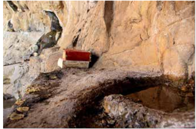
تصویر ۳. کنارهم قرار گرفتن قرآن و آب در مهرابه باستانی روستای کهنوج قدیم که امروزه با نام اسلامی چشمه مرتضی علی شناخته می‌شود. عکس: نرگس قدیانی، ۱۳۹۶.

نمادین و اجتماعی آیین‌ها سبب ارتباط و تعامل افراد با اماکن مختلف شده و بخشی از کالبد، معنا و هویت فضاهای مختلف را در ذهن افراد بازتولید می‌کند. این مسئله می‌تواند متوجه ابعاد فرهنگی یا مذهبی یک جامعه باشد که در بسیاری موارد از یکدیگر قایل تفکیک نیستند.