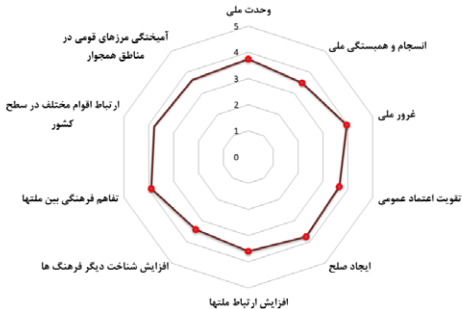
تصویر ۳. نمایش تأثیر فرهنگی گردشگری در سطح ملی.

ملت‌ها خواهد شد. در واقع می‌توان با توسعه گردشگری به همگرایی فرهنگی در سطح جهان کمک کرد. به بیان دیگر با آشناسازی گردشگران خارجی با فرهنگ ملی، می‌توان زبان گفتگو و تفاهم را در مجامع بین‌المللی تعمیق بخشید؛ و با گسترش ژئوپلیتیک فرهنگی از طریق گردشگری به صورت نرم برای مسائل ژئوپلیتیکی سیاسی و اقتصادی زمینه‌سازی کرد. نتایج به دست آمده همسو با وزبن و همکاران (۱۳۹۷) است که دست یافتند توسعه گردشگری با تبادلات فرهنگی و معرفی چهره واقعی کشور به جامعه جهانی باعث توسعه کشور و در نهایت افزایش منزلت ژئوپلیتیکی کشور در سطح بین‌المللی خواهد شد. لذا انجام اقداماتی نظیر گسترش روابط بخش‌های گردشگری کشور با سازمان‌های بین‌المللی مرتبط با گردشگری نظیر سازمان علمی، فرهنگی و آموزش سازمان ملل متحد (یونسکو)، سازمان جهانی گردشگری، شورای جهانی مسافرت و گردشگری؛ تمرکز سیاست‌های ملی توسعه گردشگری بر جذب سهم از بازارهای هدف گردشگری خارجی؛ و همچنین کاستن از سختگیری‌های اجتماعی و اقتصادی و فرهنگی برای گردشگران بین‌المللی جهت بهره‌گیری از ظرفیت‌های فرهنگی گردشگری پیشنهاد می‌شود.