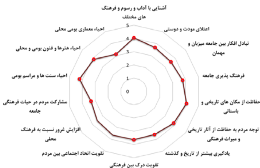
تصویر ۱. نمایش اثرات مثبت فرهنگی گردشگری بر جامعه محلی.

در تصویر ۲ دیدگاه خبرگان در خصوص تأثیرات منفی گردشگری بر جامعه محلی آمده است. براساس نتایج داده های آماری حاصل از دیدگاه خبرگان، در صورت عدم برنامه ریزی مناسب، با افزایش آمار ورودی گردشگران و افزایش ارتباطات اجتماعی محلی، اثرات منفی متعددی در مقاصد گردشگری رخ خواهد داد؛ که می توان به توسعه رفتارهای تجمل گرایانه (اثر نمایشی) با میانگین ۰/۲۴، توسعه رفتار گردشگران در جامعه مقصد با میانگین ۹۰/۳، همگرایی فرهنگی با میانگین ۸۰/۳، تحلیل تدریجی زبان محلی با میانگین ۶۲/۳، کالایی شدن فرهنگ اجتماعات محلی و تبدیل آن به یک منبع اقتصادی با میانگین ۳۲/۳، تخریب مبانی ارزشی با کمترین میانگین ۹۶/۲ و در پایان توسعه ناهنجاری های اخلاقی با پایین ترین میانگین یعنی ۷۸/۲ اشاره کرد. توسعه گردشگری علاوه بر پیامدهای فرهنگی مثبت و منفی بر